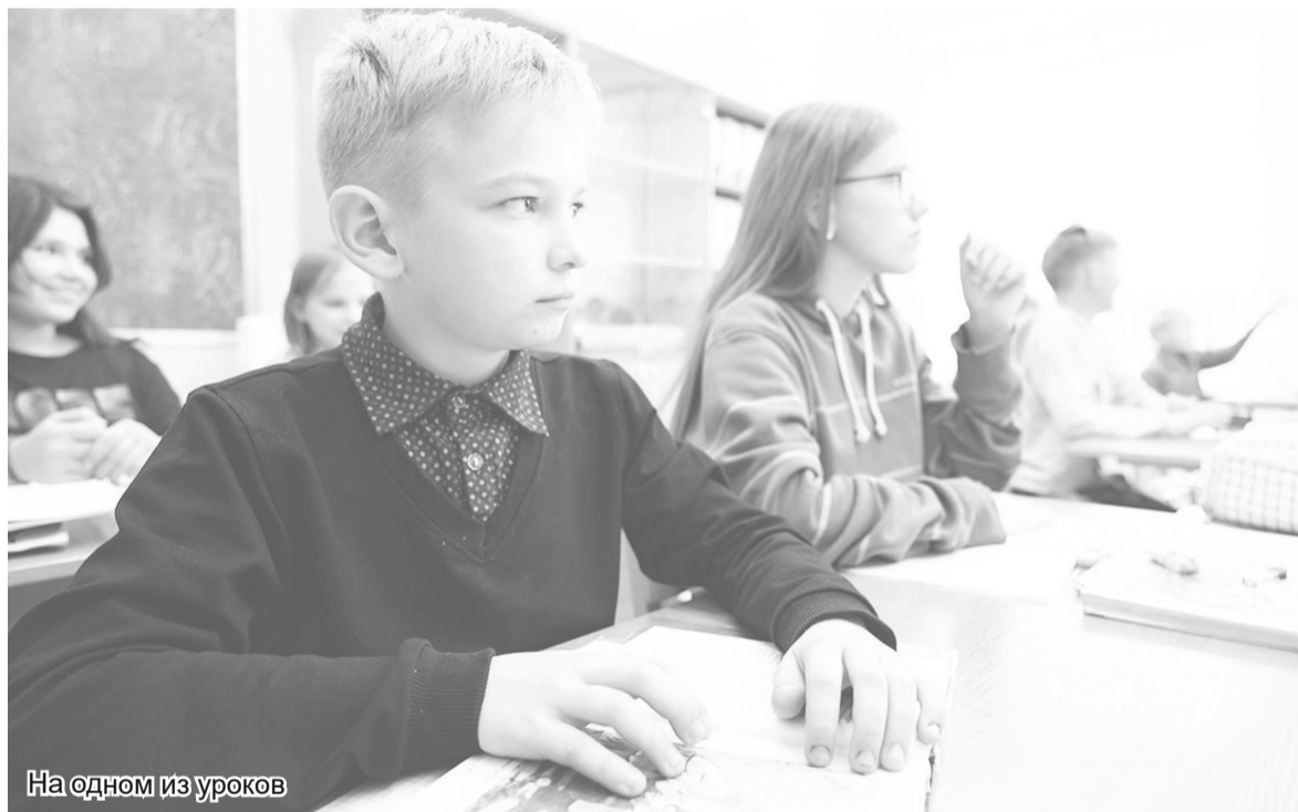
На одном из уроков

ственную информационную систему «Современное образование Ленинградской области» (ГИС «СОЛО»). Это единое цифровое пространство, которое объединило все типы образовательных учреждений региона. Единый информационный образовательный портал после модернизации входит в состав ГИС «СОЛО» — именно на нём представлены ключевые возможности всей системы. Все сервисы разделены на четыре блока в соответствии с целевыми аудиториями: «Родителям дошкольников», «Школьникам и их родителям», «Выпускникам и студентам», а также «Работодателям и организациям». Для каждой аудитории представлен свой набор услуг. Например, школьники могут посмотреть свои оценки, подготовиться к экзаменам или записаться в секцию, определиться с будущей профессией и понять, куда поступать, в том числе основываясь на индивидуальных результатах профориента-