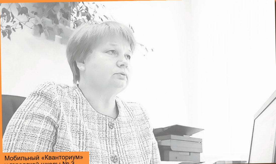
Мобильный «Кванториум» у городской школы № 3

Кроме того, с октября прошлого года в районе начал свою работу