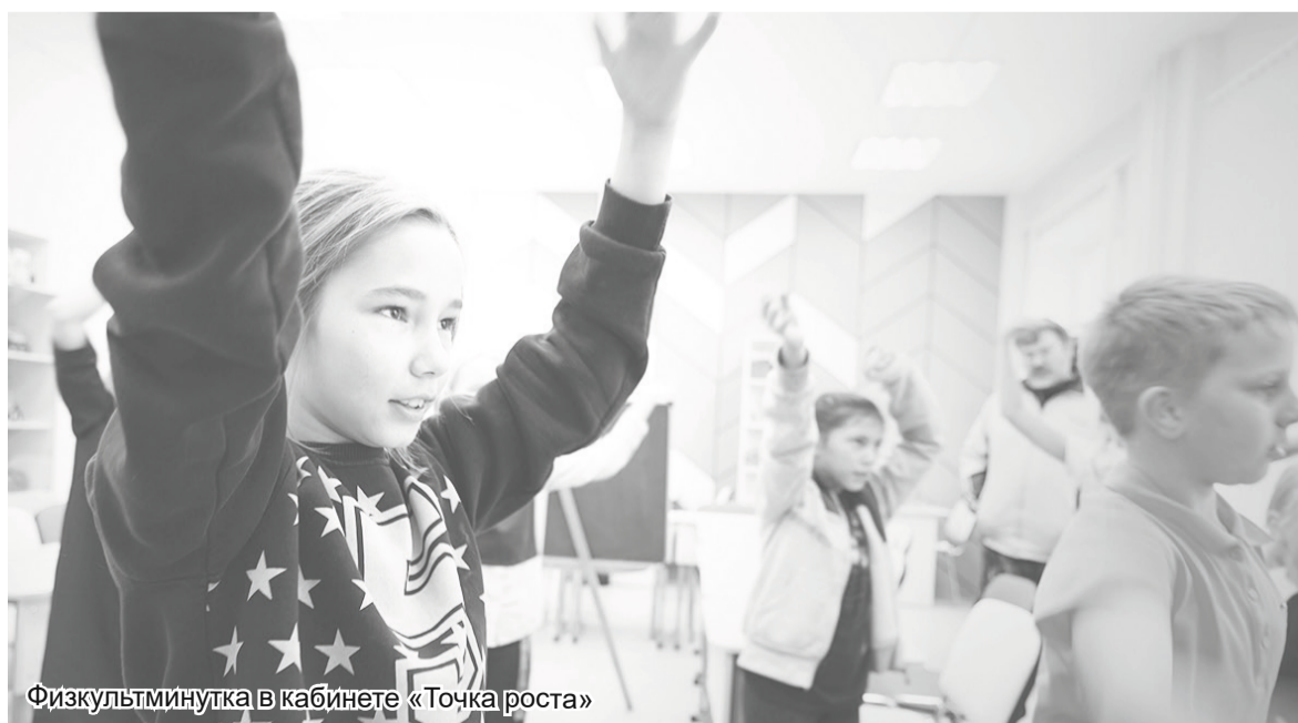
Физкультминутка в кабинете «Точка роста»