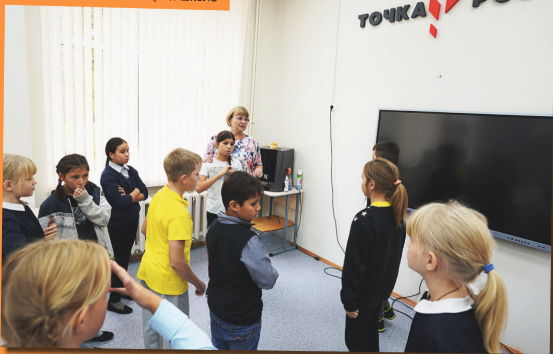
«Точка роста» в Винницкой школе